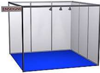
Exemple Stand nu 9m 2 (3x3) *image non-contractuelle

> Stand 9m 2 en 3x3 = 8.775 €HT (soit : 975€ ht par m 2 )