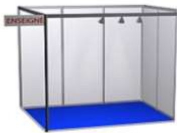
Exemple Stand nu en 6m 2 (3x2) *image non-contractuelle

> La formule "Package" reprend toutes les prestations du stand "Nu" en 6m 2 (ci-dessus) avec en plus : du Mobilier => 1 comptoir + 2 tabourets hauts + 1 table + 3 chaises, + l'Electricité : 2kW + l'Accès Internet : 1mbps mini. + 1 heure de Conférence (salle 60 à 70 places) + Participation offerte au Débat "Stratégies Globales annuelles" (Attention : le Bonus Débat est offert, uniquement si retour bulletin Stand signé avant le 15 janvier ).