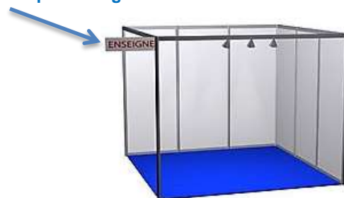
Exemple Stand nu 9m² (3x3)