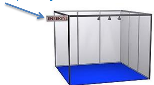
Exemple Stand nu 9m² (3x3) *Schéma non-contractuel