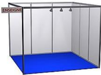
Exemple Stand nu 9m 2 (3x3) *image non-contractuelle

> 6m 2 en 3x2 = 5.322 €HT (887€ ht /m 2 x 6m 2 )