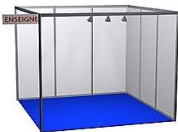
Exemple Stand nu 9m 2 (3x3) *image non-contractuelle

> La formule "Package" reprend toutes les prestations du stand "Nu" 6m 2 (ci-dessus) avec en plus : du Mobilier => 1 comptoir + 2 tabourets hauts + 1 table + 3 chaises , + l'Electricité : 2kW + l'Accès Internet : 1mbps min. + 1 heure de Conférence (salle 60 à 65 places) + Participation offerte au Débat "Stratégies Globales" (Attention : Bonus Débat offert, uniquement si retour bulletin Stand signé, avant le 15 janvier 2024).